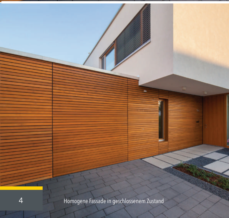
Homogene Fassade in geschlossenem Zustand