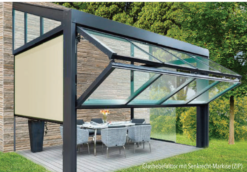
Glasbefalttor mit Senkrecht-Markise (ZIP)