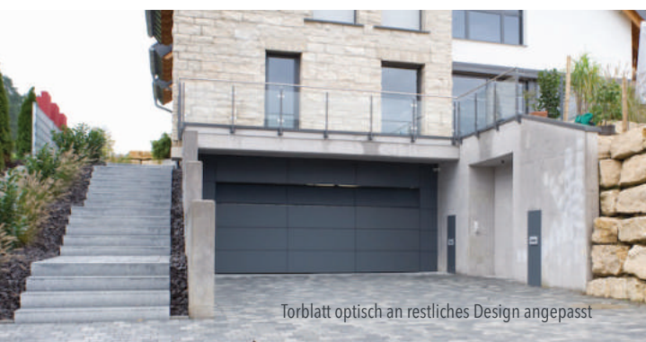
Torblatt optisch an restliches Design angepasst

Im Projekt, welches unterhalb dargestellt ist, lieferte BeluTec ein ca. 5000 x 2200 mm großes flächenbündiges Sektionaltor. Das Tor besteht aus einer Aluminium-Rahmen-Sprossen-Konstruktion mit ausgeschäumten Stahl-Sandwich-Paneelen. Aufgeteilt ist das Torblatt in der Breite in drei Felder und in der Höhe in vier Sektionen. Es wurde für die Aufnahme einer bauseitigen Beplankung von 10 mm Trespa und 20 mm Lattung vorbereitet. Die oberste Sektion des flächenbündigen Sektionaltores wurde als Kipflügel zur Be- und Entlüftung ausgeführt.