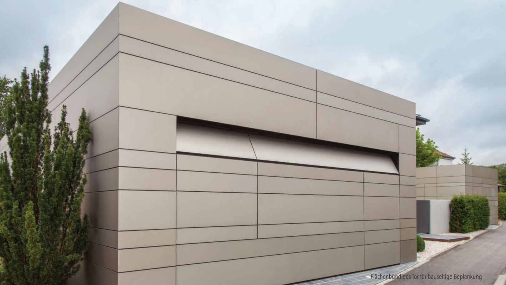
Flächenbündiges Tor für bauseitige Beplankung