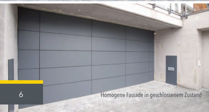
Homogene Fassade in geschlossenem Zustand