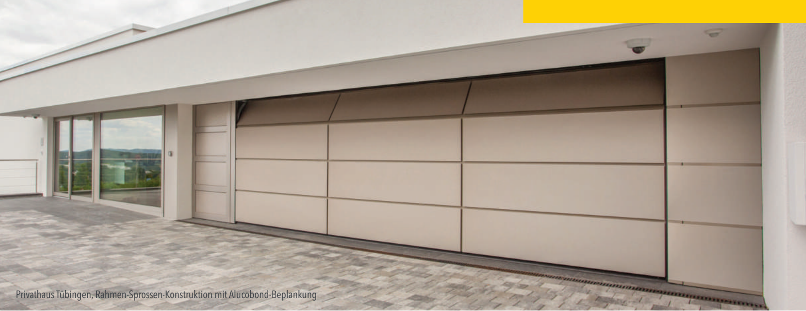
Privathaus Tübingen, Rahmen-Sprossen-Konstruktion mit Alucobond-Bepankung