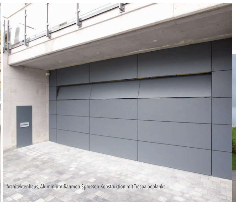
Architektenhaus, Aluminium-Rahmen-Sprossen-Konstruktion mit Trespa beplankt