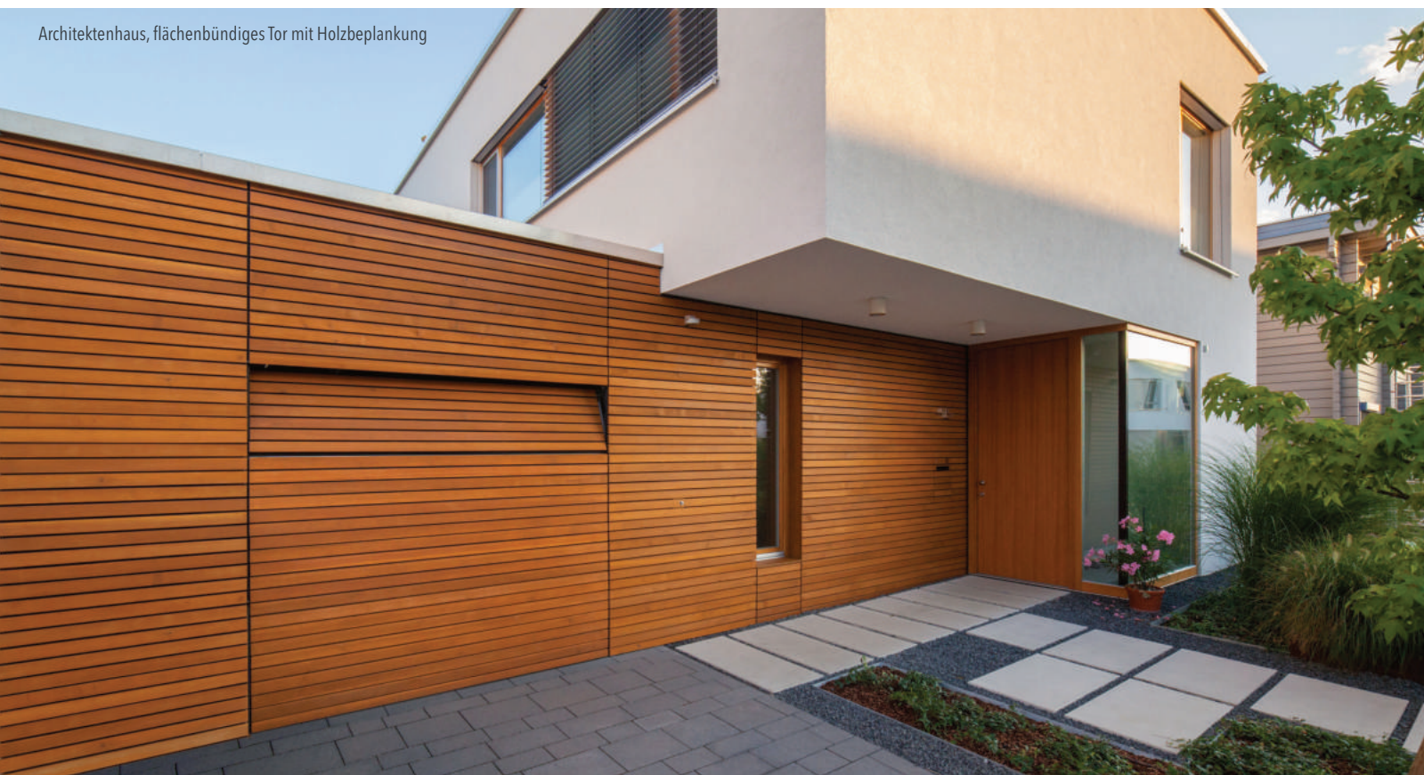
Architektenhaus, flächenbündiges Tor mit Holzbeplankung