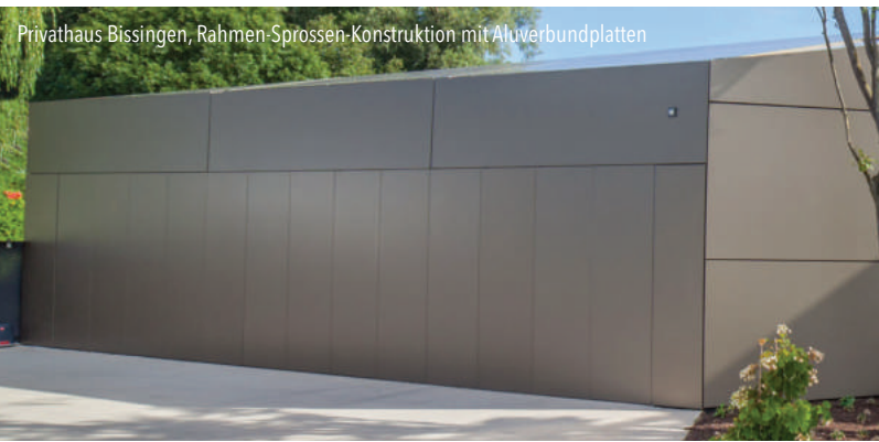
Privathaus Bissingen, Rahmen-Sprossen-Konstruktion mit Aluverbundplatten