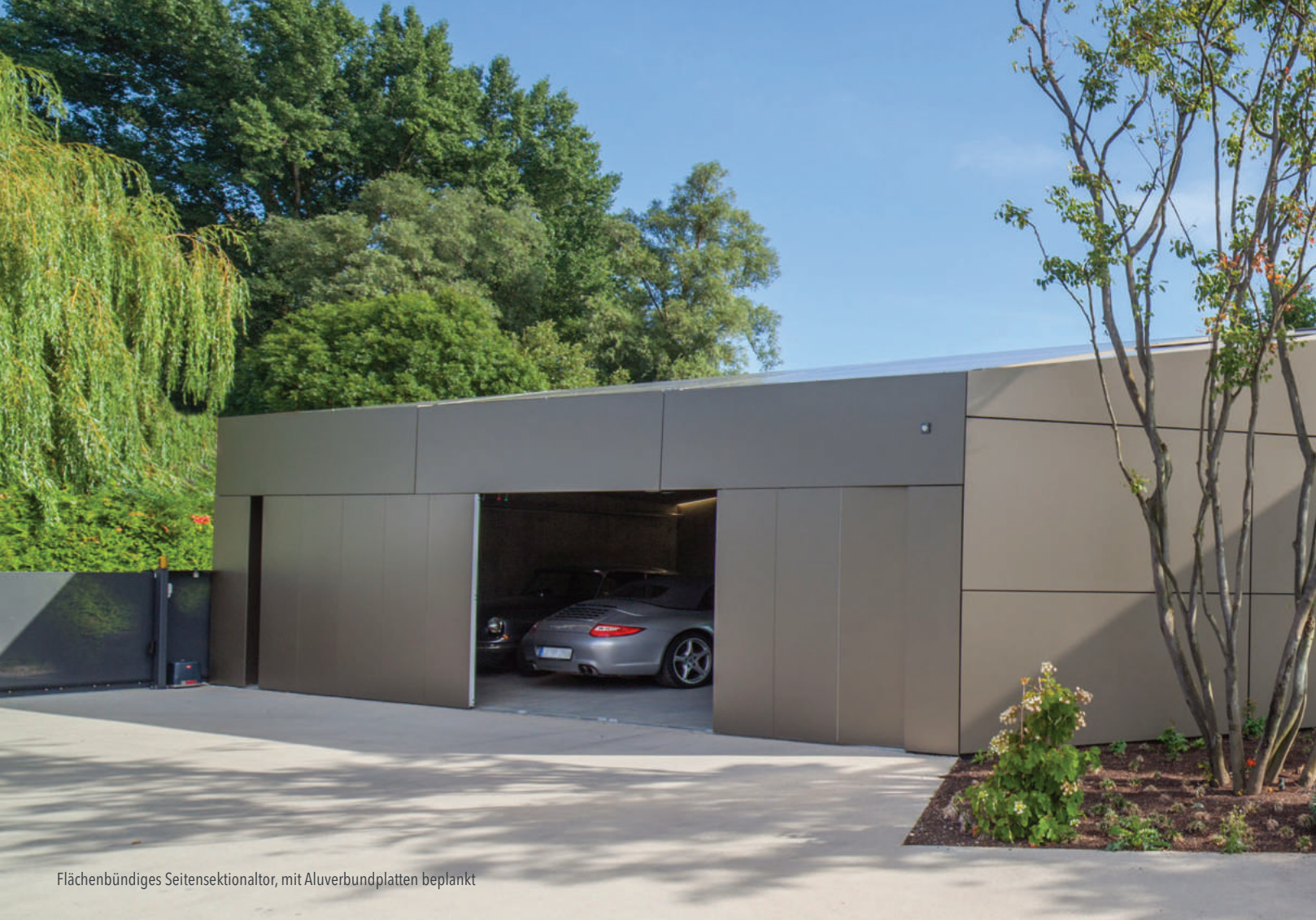
Flächenbündiges Seitensektionaltor, mit Aluverbundplatten beplankt