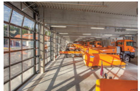
Integrierte Lüftungsfunktion bei am Boden geschlossenem Tor