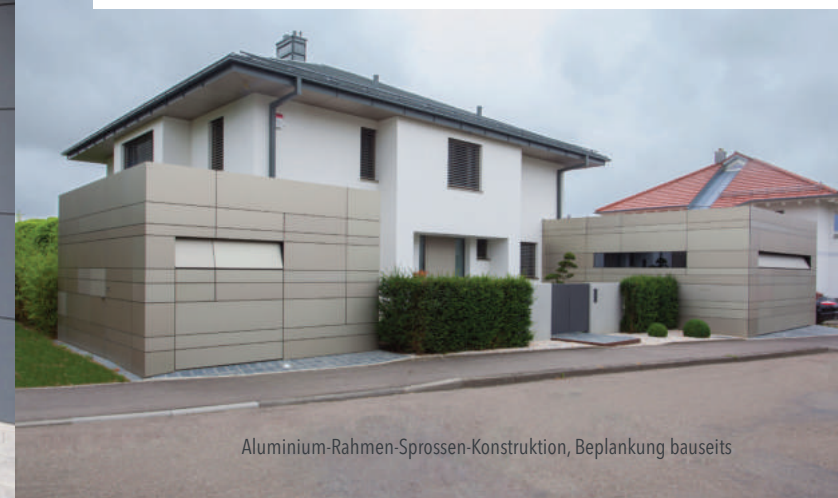
Aluminium-Rahmen-Sprossen-Konstruktion, Beplankung bauseits