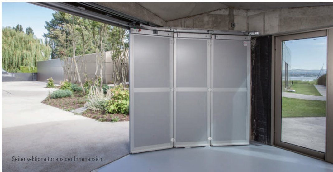
Seitensektionaltor aus der Innenansicht