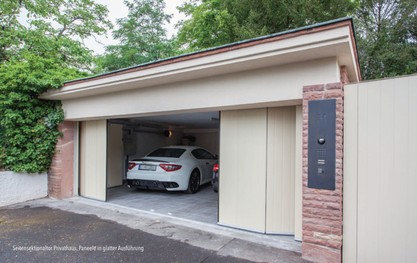
Seitensektionaltor Privathaus, Paneele in glatter Ausführung